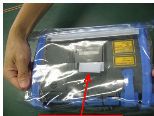
マジックテープで固定