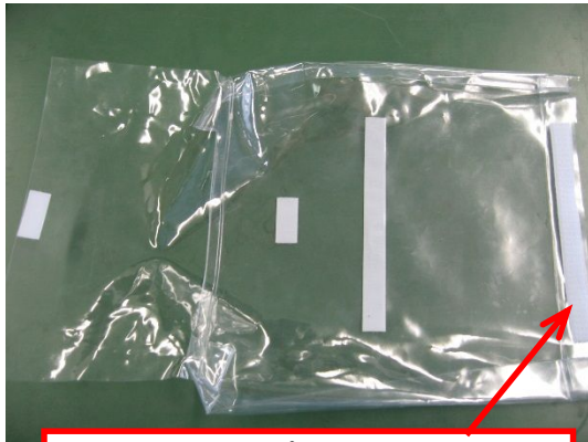
このマジックテープが貼ってある面を上