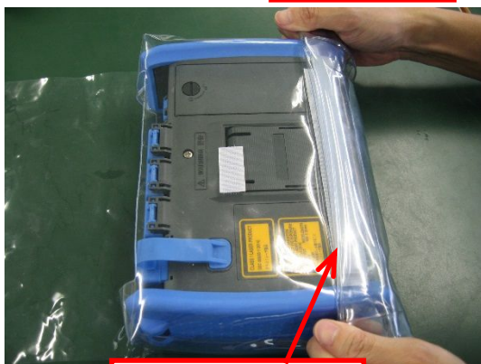
マジックテープで固定